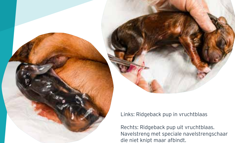
Links: Ridgeback pup in vruchtblaas

BIJ EEN EERSTE NESTJE HERKENT DE TEEF HET GEVOEL VAN BEVALLING NIET EN DENKT ZE MISSCHIEN DAT ZE ZICH MOET ONTLASTEN. VOLG JE TEEF DAAROM OVERAL OP DIE MOMENTEN, WANT ZE ZOU ZOMAAR HAAR EERSTE PUP IN DE TUIN KUNNEN BAREN!