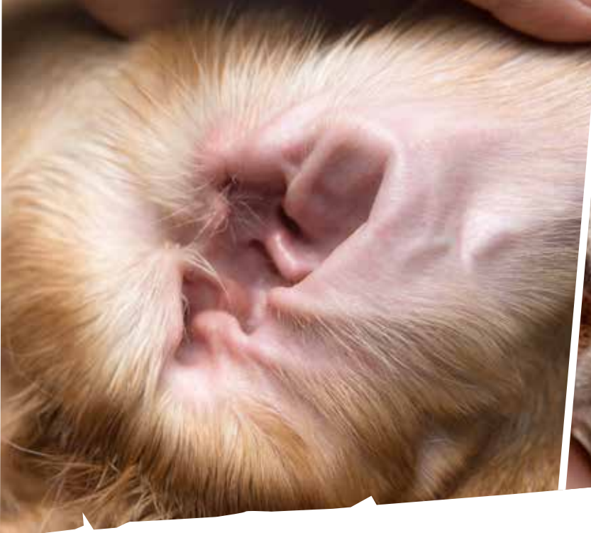
Oreille en bonne santé